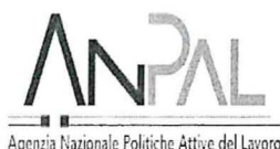
Agenzia Nazionale Politiche Attive del Lavoro