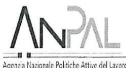
Agenzia Nazionale Politiche Attive del Lavoro