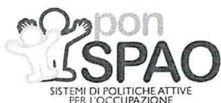
SISTEMI DI POLITICHE ATTIVE PER L'OCCUPAZIONE