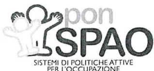
SISTEMI DI POLITICHE ATTIVE PER L'OCCUPAZIONE