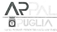
Agenzia Regionale Politiche Attive del Lavoro - Puglia