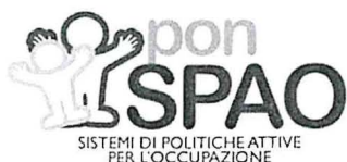
SISTEMI DI POLITICHE ATTIVE PER L'OCCUPAZIONE